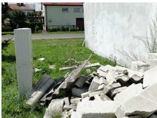
Zdjęcie 7. Porzucone odpady azbestu w rejonie ulicy Cisowej 10