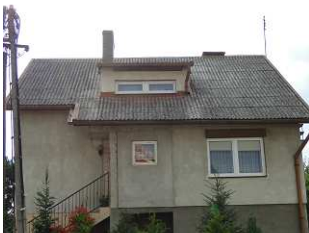
Zdjęcie 3. Dach wykonany z płyt azbestowo-cementowych na budynku mieszkalnym jednorodzinnym