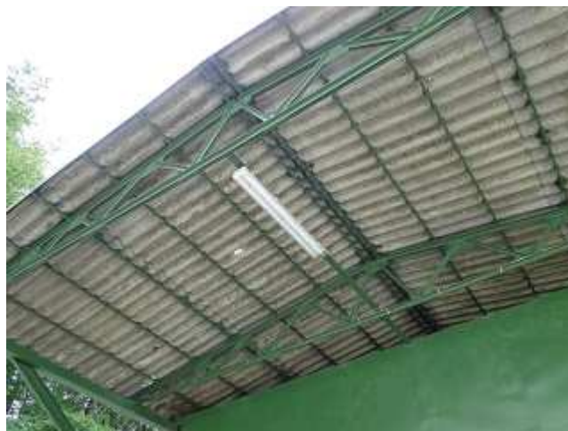
Zdjęcie 6. Zadaszenie wiaty magazynowej wykonane z falistych płyt azbestowo-cementowych