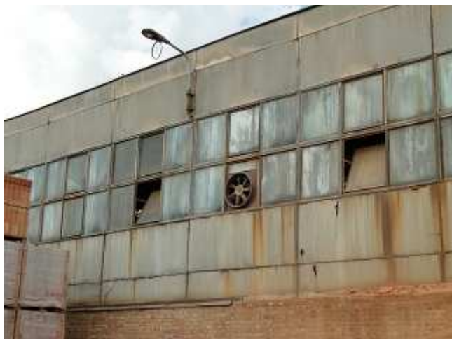
Zdjęcie 5. Elewacja obiektu przemysłowego wykonana płaskich płyt azbestowo-cementowych