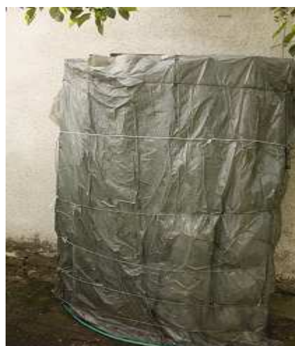
Zdjęcie 8. Zdemontowane płyty azbestowo-cementowe na terenie prywatnej posesji