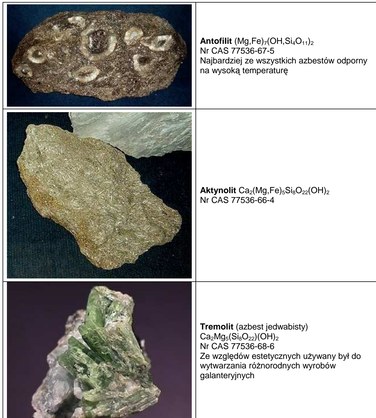
Zdjęcie 2. Najczęściej spotykane rodzaje minerałów azbestu