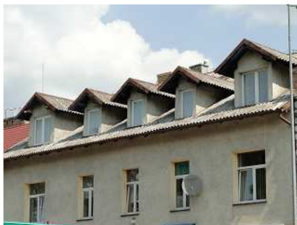
Zdjęcie 4. Dach wykonany z płyt azbestowo-cementowych na budynku mieszkalnym wielorodzinnym